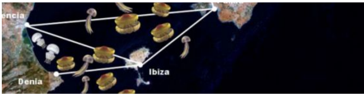
Mapa estacional de la aparición de medusas en verano